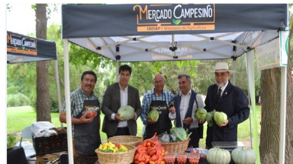
Mercados campesinos en Chile y Colombia, en donde se venden frutas y verduras: infraestructura estandarizada, profesionalización, fáciles de instalar y con un fuerte impacto comercial