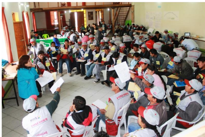
Reunión Yachachiq. Asistencia técnica horizontal (campesino-campesino). FONCODES-Perú