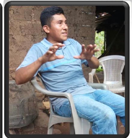
Protagonistas de las diez mejores experiencias agroecológicas del mapeo 2016